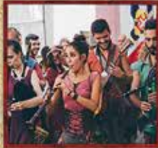
SONS DA SUÉVIA