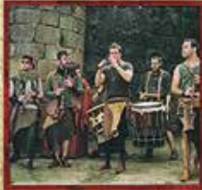
VERITAS NOSTRA (ESP)