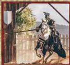
OS CAVALEIROS DO TEMPO