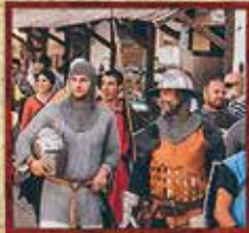
GUARDA DO ALCAIDE DE ÓBIDOS