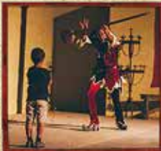
SALTIMBANCO DA CHARNECA