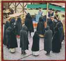
DANÇAS ANTIGAS JOSEFA D'ÓBIDOS